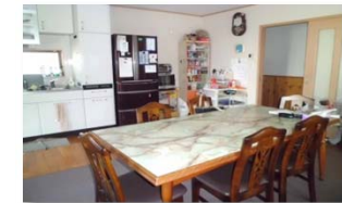
みんなが集まるリビング